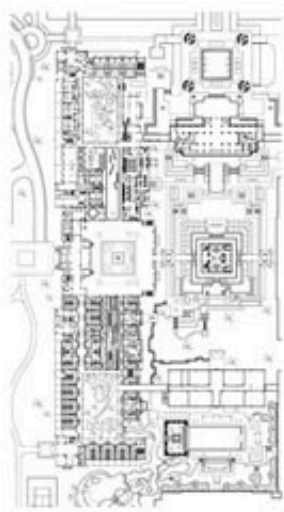
项目地址：海口市海南大道55号 酒店类型：五星级豪华酒店 建筑面积：300,000㎡ 开业时间：2015年10月 设计团队：奕都国际设计/奕都国际